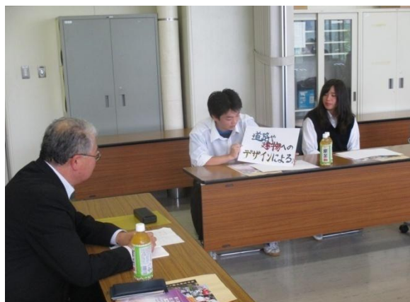
生徒によるプレゼンテーションの様子