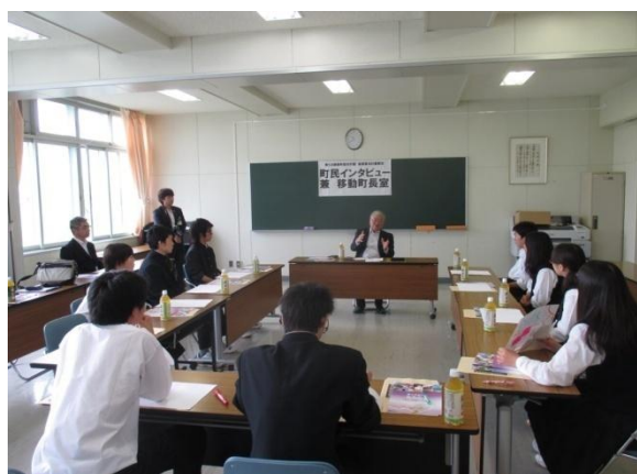
活発な議論が交わされました