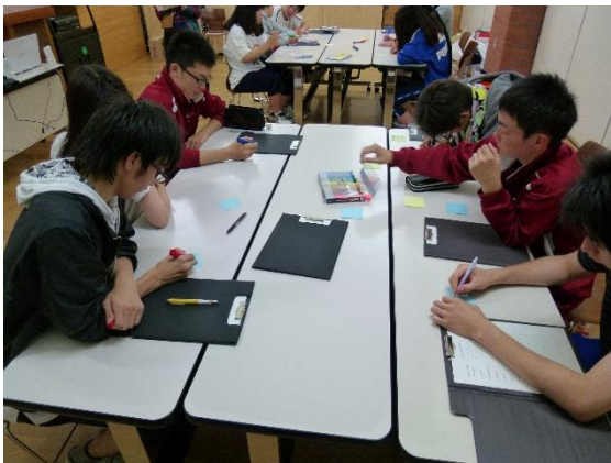
生徒会としてどのような取り組みができるかを一人一人が考え書いています。