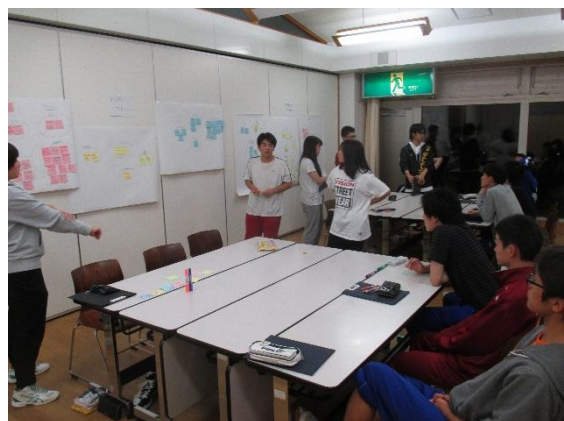
自分たちの考えを違うグループに発表し、意見を交換しました。