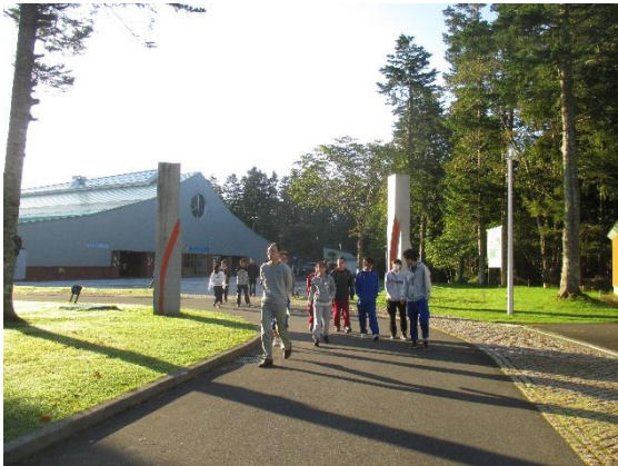
晴れている朝の散歩気持ちいい。