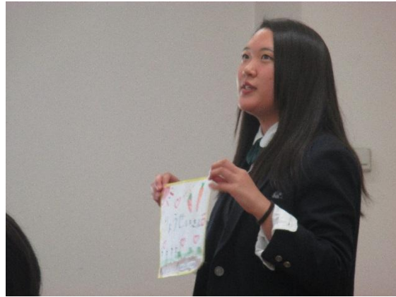
みんなの前で決意を発表しました。