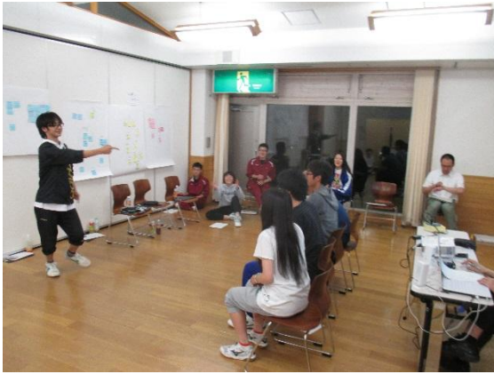
レクリエーションでジェスチャーゲームをして盛り上がりました。