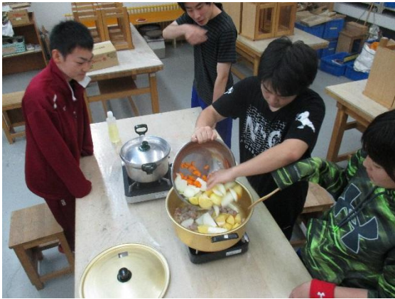
2班に分かれてのカレー作り。