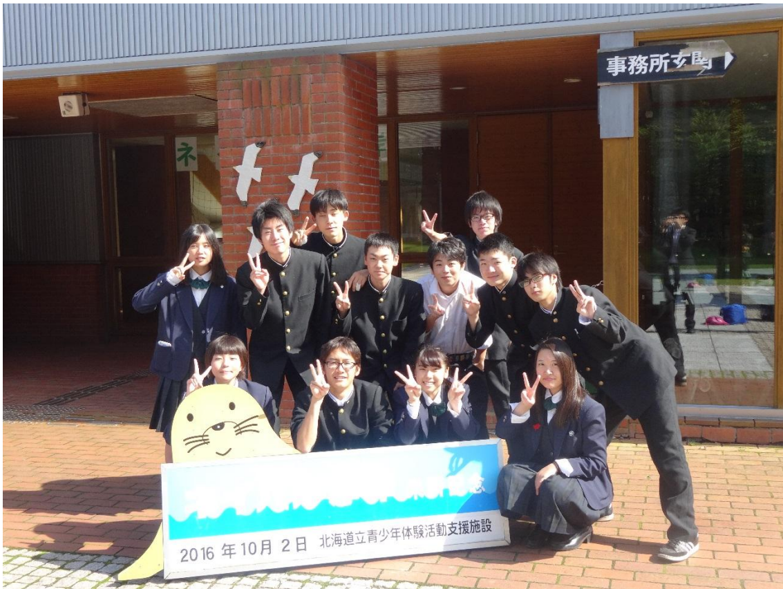
これから第40期の新執行部が活躍していきます。