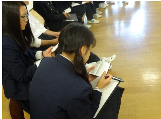
生徒手帳を見て生徒会組織について考える。