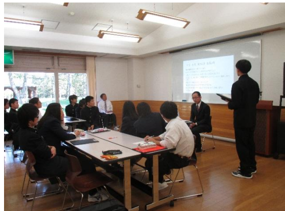
旧執行部から新執行部に向けてアドバイスをもらい全員が真剣に聞いていました。