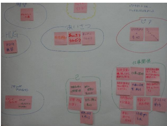
すぐに取り組める内容。