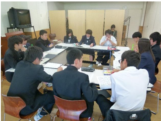
行事の確認をして、いつから取り組んでいくかについて話し合いました。