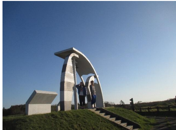
アイカップ岬の風景はとてもきれいでした。