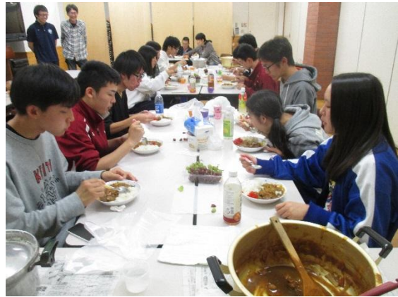
どちらの班も美味しくできました。