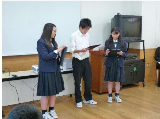
緊張しながらの他己紹介。