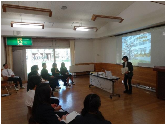
執行部のあり方について考える。