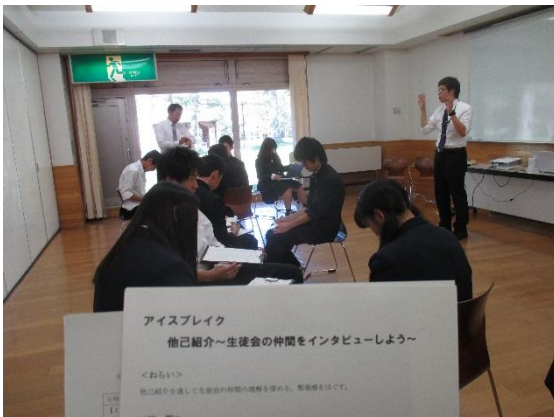
インタビューをして情報収集。

1泊2日でしたが、決意を新たに、先輩方が築き上げてきたことを引き継ぎながら、新たな取り組みを行っていきけるようになっていきます。